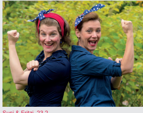
Susi & Fritzi_23.2.