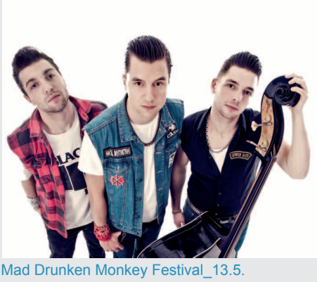
Mad Drunken Monkey Festival_13.5.