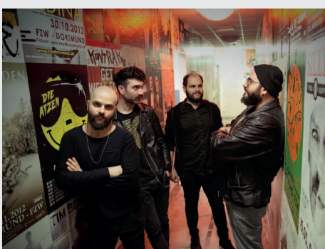
Who killed Bruce Lee...11.11.