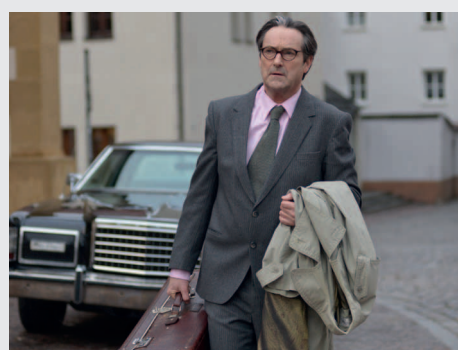
Tod eines Handlungsreisenden...14.11.