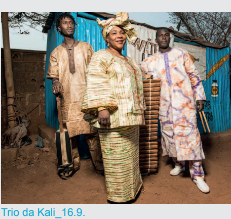
Trio da Kali_16.9.