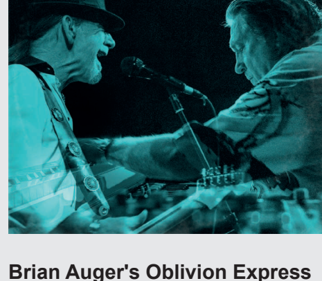
Brian Auger's Oblivion Express feat. Alex Ligertwood

Vor fünf Jahren haben sie schon einmal das Publikum in der alten Brauerei begeistert, und am 11. Oktober kommen sie wieder: Brian Auger mit seiner Band „Oblivion Express“ und Alex Ligertwood, der 16 Jahre lang die Stimme von Carlos Santana war. Das Konzert verspricht Jazz-Rock vom Allerfeinsten.