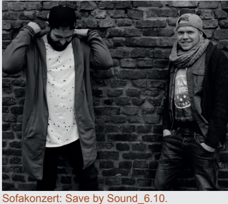
Sofakonzert: Save by Sound_6.10.