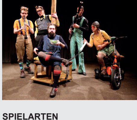
SPIELARTEN Kinder- und Jugendtheaterfestival NRW

SPIELARTEN 2018 lädt in 10 Städten zu 11 künstlerisch und formal besonderen Inszenierungen des Freien Theaters für Kinder und Jugendliche ein. Das Netz der Veranstalterstädte spannt sich von Münster nach Köln, von Viersen nach Paderborn, von Düsseldorf nach Herne und darüber hinaus. Theater in unterschiedlichen Facetten und für verschiedene Altersklassen wird dabei auch in Herne vorgestellt: Das Marabu Theater aus Bonn zeigt Musiktheater für Kinder ab 4 und stellt dabei höchst philosophische Bären-Fragen in „Der Bär, der nicht da war“. Aber auch die Klassiker der Kinderliteratur sind vertreten: „Krabat“ vom Ensemble c.t.201 und das „Doppelte Lotchen“ vom Comedia-Theater, beide aus Köln, in jeweils sehr ungewöhnlichen Zugriffen auf den Stoff: partizipativ und mit wilder Rahmenhandlung. „Das schaurige Haus“ vom zeitzeit-theater aus Münster wiederum kombiniert Gruselgeschichte, Krimi und soziale Studie als Stoffe für ältere Kinder und Jugendliche. Weitere Infos: www.spielarten-nrw.de