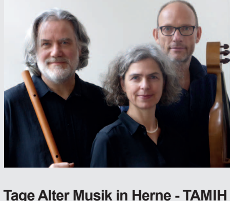
Tage Alter Musik in Herne - TAMIH Todssünden

Was sind Todssünden? In unserem Alltag gibt es sie als sprichwörtliche kleine "No-Gos" beim Fußball, an der Börse, beim Kochen. Der Theologie ging es immer um mehr. Alle menschlichen Werke seien eine Todssünde, sagte Martin Luther vor 500 Jahren in der Heidelberger Disputation. Die katholische Kirche ist da schon seit Papst Gregor I. mit den sieben Todssünden konkreter. Von jeher stellen sie einen Anreiz zur künstlerischen Auseinandersetzung dar - das wohl bekannteste Bild dazu hat Hieronymus Bosch gemalt. In der Musik findet man solch eine Auseinandersetzung vergleichsweise selten. Vielleicht, weil man die Musik mit Luther gerade als Mittel gegen Zorn, Zank, Hass, Neid, Geiz, Sorge, Traurigkeit und sogar Mord empfindet. Umso reizvoller ist es, bei einem Festival wie den Tagen Alter Musik in Herne herauszufinden, wie sich das, was der kirchliche Todssünden-Kanon im Sinn hatte, in der Musik vergangener Zeiten widerspiegelt.